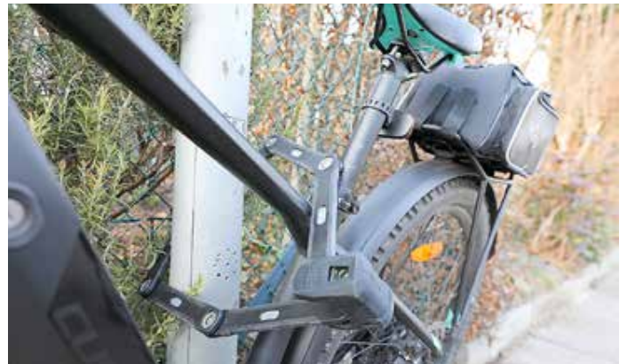
Faltschloss an einem E-Bike

https://www.polizei-beratung.de/themen-und-tipps/diebstahl-diebstahl-von-zweiraedern