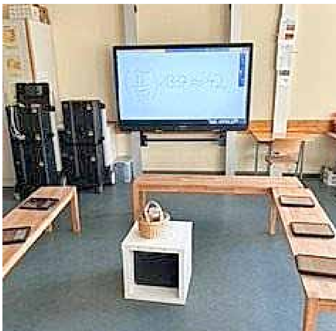
Mittig im Hintergrund ein ActivPanel

Die Tablets sind bereits eingetroffen und werden in nächster Zeit an die Schulen übergeben, sobald ein großes, allseits bekanntes Unternehmen die Glasfaseranschlüsse in allen Schulen endlich angeschlossen hat.