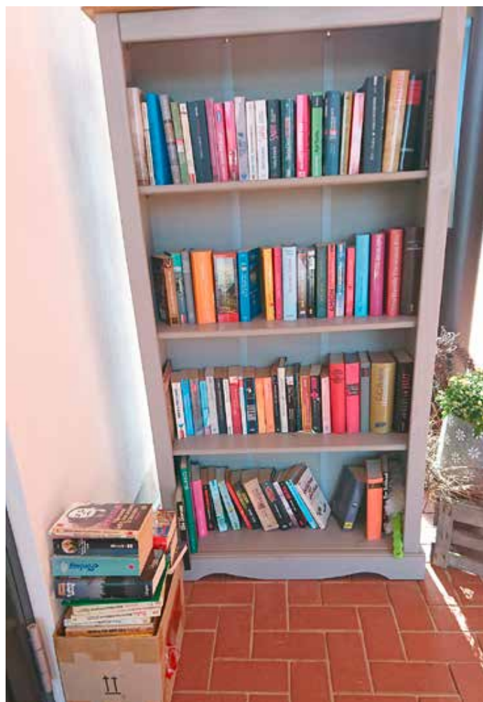
Bücherbox der Bürgergemeinschaft Wahrenholz

Die Bürgergemeinschaft Wahrenholz e. V. wünscht allen Freunden der Literatur viel Spaß beim Lesen.