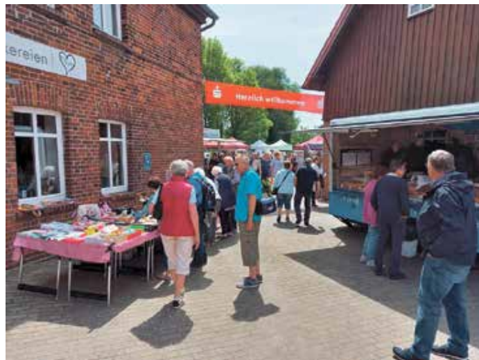
Viele zufriedene Besucher aus Nah und Fern

Unsere nächste Veranstaltung ist das Weinfest. Schauen Sie doch am Samstag, 19. August 2023 ab 15.00 Uhr , einmal vorbei und genießen Sie mit uns den Sommer an der historischen Wassermühle.