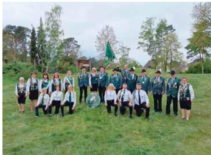
Das neue Wagenhoffer Königshaus

An allen drei Tagen gab es zum Tanz Musik von drei verschiedenen DJ's, jeder brachte den Saal so in Stimmung, dass bis in die frühen Morgenstunden gefeiert wurde.