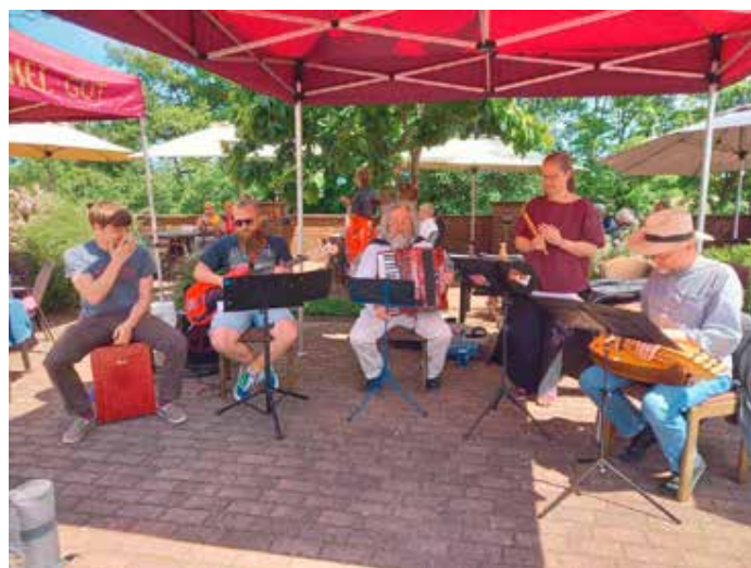
Ein gelungener Auftritt