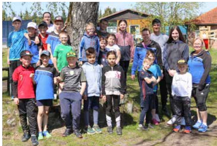
Ausrichter und Teilnehmer des Tennis- und Bewegungscamps

Das Tennis- und Bewegungscamp lockte auch einige tennisinteressierte Kinder an, die gerne in den weißen Sport schnuppern wollten. Vielleicht befindet sich ja unter ihnen der nächste große Nachwuchsstar des TSV Schönewörde.